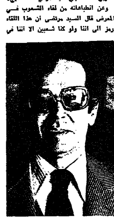
السفير المصري في احتفالات «يوم السلام»

حيفا - من سفيق منصور - عرب السيد سعد الدين مرتضى سفير جمهورية مصر العربية لدى اسرائيل عن تافه البالغ للحفاة التي قوبل بها أثناء زيارته أمس لعرض التهور الدولي الثالث والعشرين (فلورنسى ٨٠) المقام في حيفا . وراعيته للقاء المسلمين الشعوب الذي نظم في حدائق العرض والذي حضره عدد كبير من المدعوين .